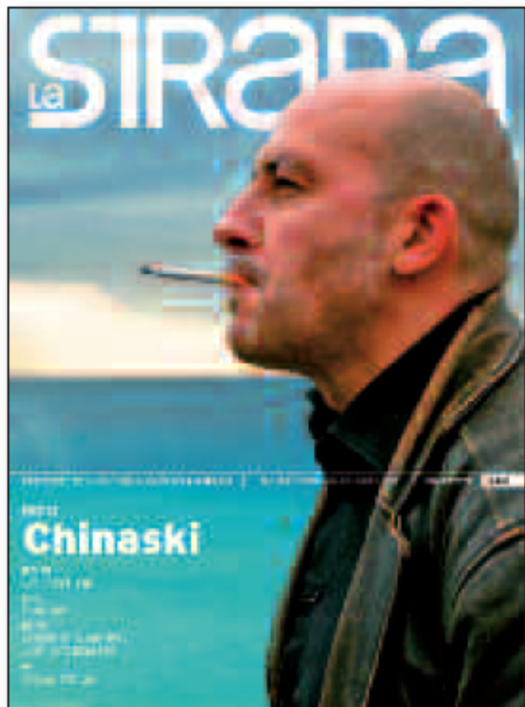
Le dernier numéro avec un portrait de Chinaski